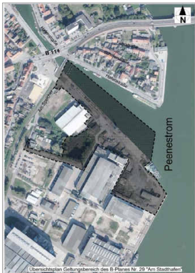
Übersichtsplan Geltungsbereich des B-Planes Nr. 29 „Am Stadthafen“