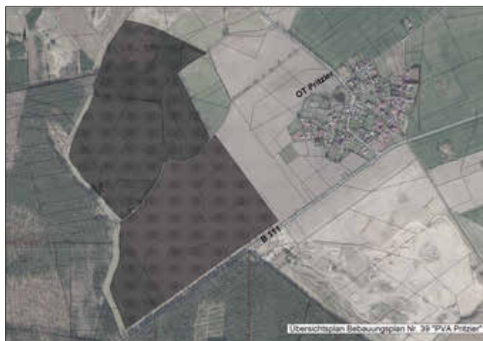
Übersichtsplan Bebauungsplan Nr. 39 „PVA Pritzier“